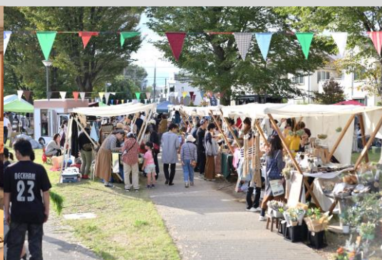
△つながりづくりのための施策