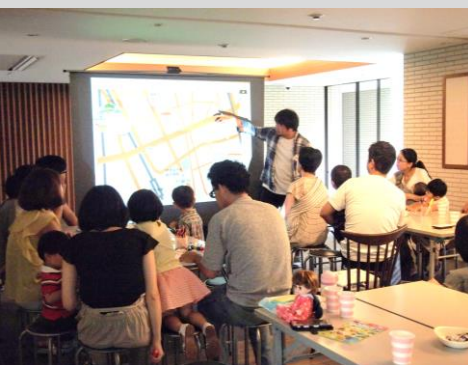
△リアルな防災ワークショップの一面

1980年生まれ。デベロッパー在籍時のCSR部署の立ち上げを経て、2010年にHITOTOWA INC.を創業。集合住宅を軸にした人々のつながりをつくることで都市の社会課題を解決するネイバーフッドデザイン事業、サッカー・フットサルを通じた課題解決を行うソーシャルフットボール事業を展開。マニフェスト大賞 優秀復興支援・防災減災賞やグッドデザイン賞、グッド減災賞等を受賞。東京都住宅政策審議会委員、Jリーグ社会連携検討部会委員等を歴任。障がいの有無に関係なく、健常者のリーグで高みを目指すインクルーシブ・フットサルチーム「バルドラール浦安デフィオ」に選手として所属。